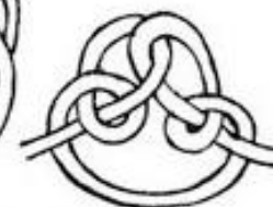
е) Огонь сварожичь