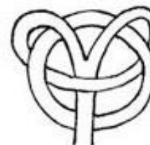
д) Мировое дерево