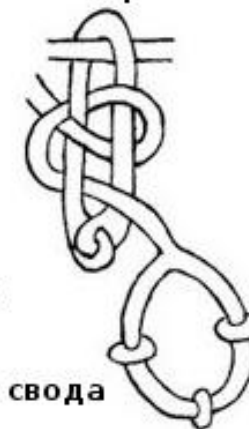
и) Три небесных свода